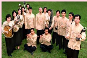
是專屬老人文化，也可是全民文化。」

妙音樂集樂團是國內第一個職業視障國樂團，於民國89年成立，十多位團員大都是文化大學及國立藝術學院的科班畢業，因為同是對傳統音樂熱愛而聚首。他們珍惜本身所受之專業訓練，也認為國樂是前人博大精深之文化財產的心血結晶，力持在傳統文化上能承先啟後，將精緻的國樂之音，傳遞給社會每個需要關懷的角落，以音樂回饋社會，因此其演出足跡遍及全國校園、社區、監所等地。