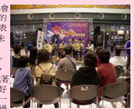
小朋友歡樂的笑聲與視障藝術家悠揚的歌聲、樂聲中結束。